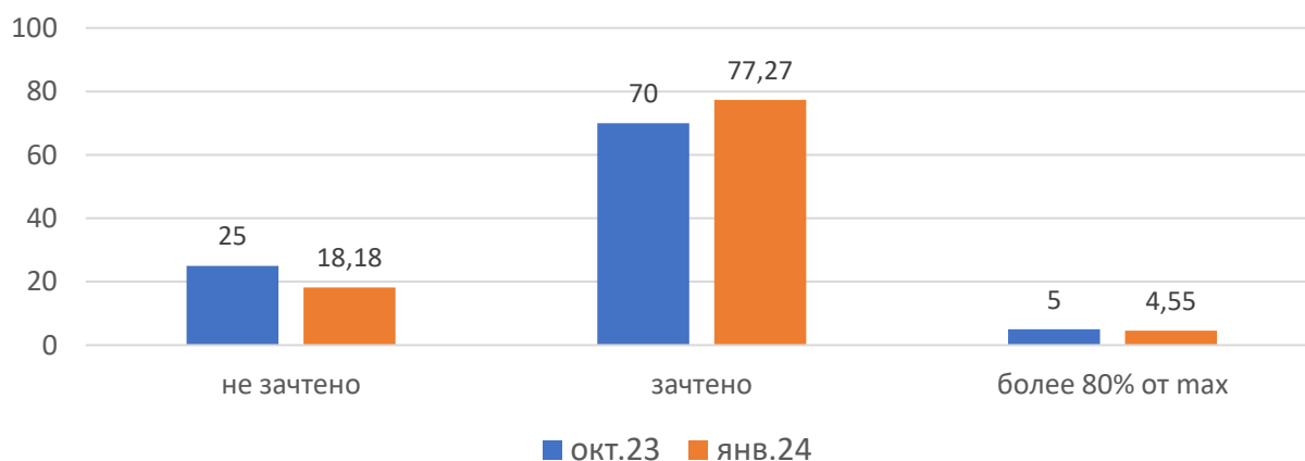
Рисунок 1. Основные результаты ДР по биологии

На рисунке 1 представлены основные результаты ДР по биологии в МСУ. В октябре 2023 г., январе 2024 г. в МСУ не было участников, набравших максимальный балл.